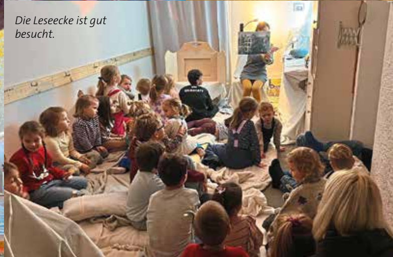
Die Lesecke ist gut besucht.