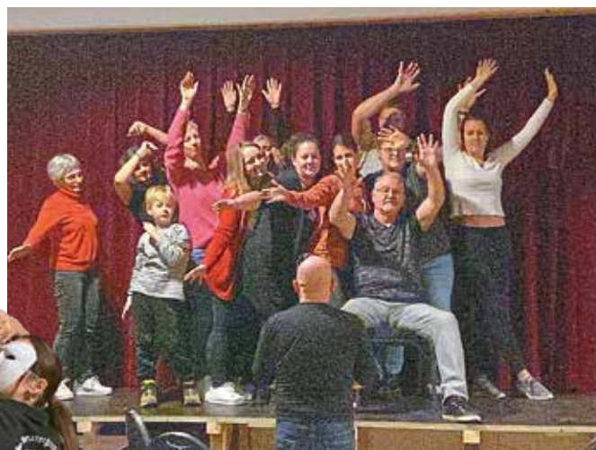
Druck sich in Bewegung, Gesang und Improvisation üben.