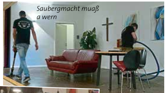
Saubermacht muaß a wern