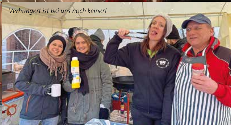
Verhungert ist bei uns noch keiner!