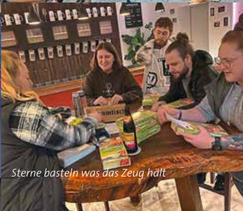
Sterne basteln was das Zeug hält