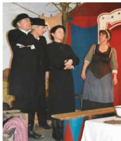
2005 begab sich die Truppe auf den Pfad der „Komödianten“. Unvergessen mit Flohzirkus, Gewichtheber, Zirkusdirektor, Seiltänzerin einen Clown der zu Herzen ging sowie das biestige Dorf.