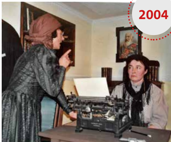
Beim nächsten Stück „Umdraht“ im Jahre 2004 wollten die Zuschauer dann schon 7 Aufführungen.