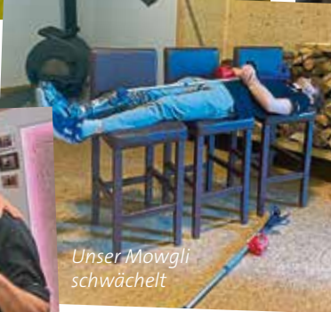
Unser Mowgli schwächelt