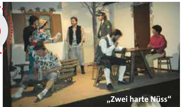
„Zwei harte Nüss“