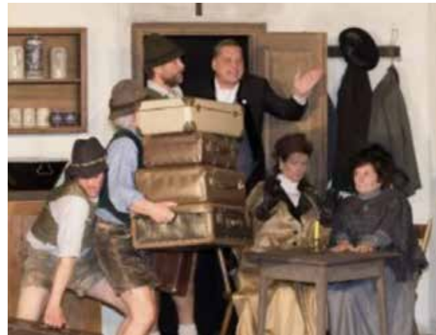
2017 das Wilderer-Stück „ Wias lafft, laffts. “