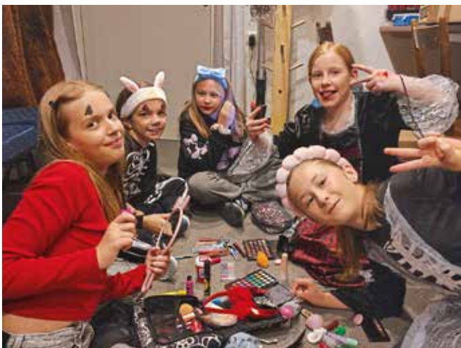
Halloween Party Theater Kids