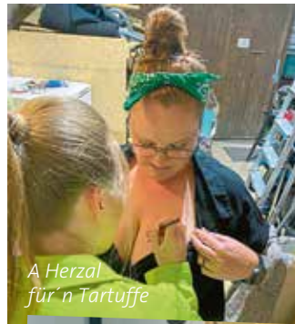
A Herzal für n Tartuffe